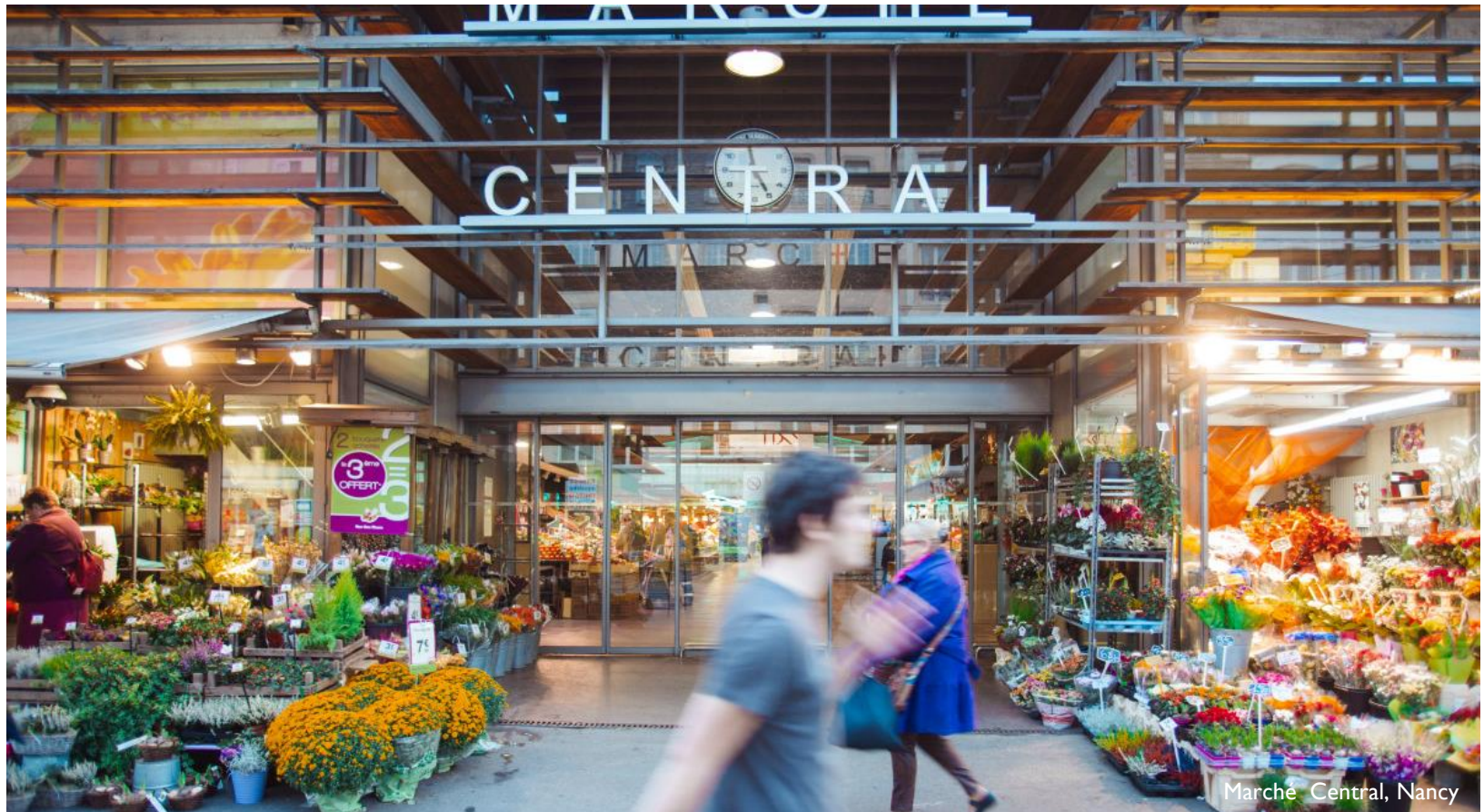
Marché Central, Nancy